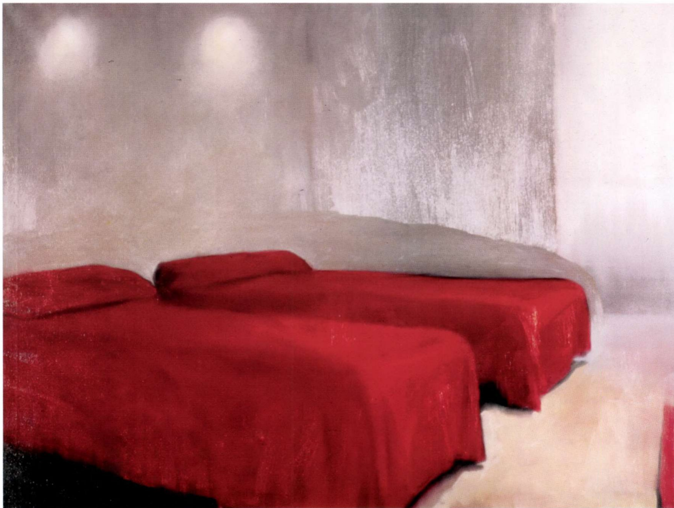
Ágy, 1997 olaj, vászon, 150 x 200 cm